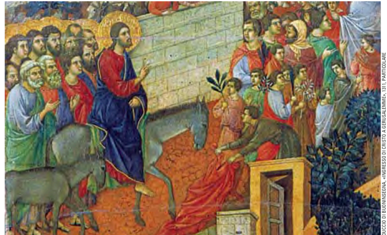
DUCCIO DI BUONINSEGNA, «INGRESSO DI CRISTO A GERUSALEMME», 1311, PARTICOLARE

» Programma Oggi l'intervento in video di Papa Benedetto XVI