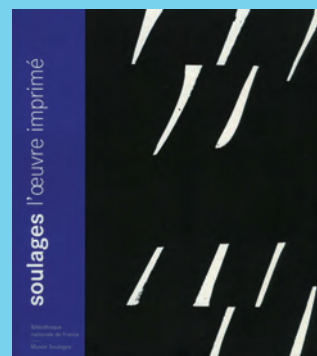
SOULAGES, L'ŒUVRE IMPRIMÉ Bibliothèque nationale de France – Musée Soulages – 40 €

Comment un tableau du xvi e siècle, La Cène , de Pieter Coecke Van Aelst, peut-il révéler son sens caché ? Jacques Lauprêtre se livre à un magistral décryptage des sens cachés de l'œuvre dans laquelle sont représentés nombre d'acteurs de la Réforme et de l'Église catholique de l'époque, amis ou rivaux. Il repère les indices (chiffres, lettres) disséminés par l'artiste. Si on ne le suit que difficilement sur certaines conclusions (lettres formées par les plis des vêtements par exemple), tout reste plausible et les comparaisons avec d'autres œuvres, très éclairantes.