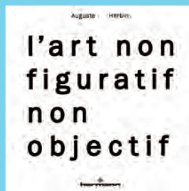
L'ART NON FIGURATIF NON OBJECTIF Auguste Herbin Hermann – 34 €