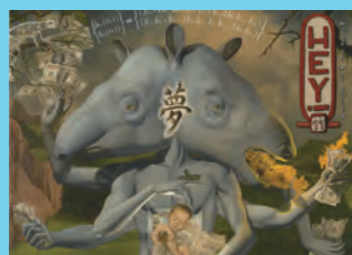
HEY (revue trimestrielle) 18 €/n° – 72€ à l'année