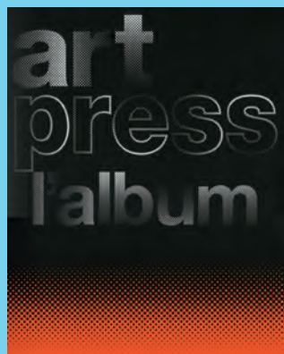
ART PRESS, L'ALBUM Éditions de La Martinière – 49 €

La revue Art Press est née avant que ne soit créé le Centre Georges-Pompidou. Depuis 40 ans, la revue suit, accompagne, voire impulse la vie artistique qui se déroulait alors essentiellement dans la capitale. Le premier numéro (janvier 1973) contenait une interview de Marcel Duchamp par Catherine Millet, la fondatrice de la revue. Depuis, les rédacteurs sont devenus plus nombreux et les sujets se sont diversifiés vers d'autres formes de pensées créatrices (littérature, architecture, cinéma...). 40 ans plus tard, cette revue retrace son parcours avec les unes de tous ses numéros, les articles les plus marquants. Une rétrospective qui livre aussi une évolution du discours sur l'art.