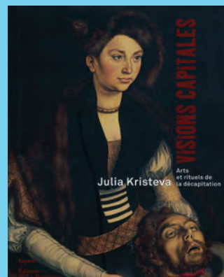
VISIONS CAPITALES Arts et rituels de la décapitation Julia Kristeva Éditions de La Martinière – 35 €

Auguste Herbin était un des peintres du cubisme et a participé à l'émergence de l'abstraction (voir notre article p. 42). L'ouvrage est une réédition de l'original de 1949. Il s'agit de la théorisation de toutes ses recherches sur le jeu des formes et des couleurs, illustrée d'œuvres et d'esquisses. L'artiste explore et démontre les effets visuels, étudie la couleur et l'obscur, la forme et la contre-forme, en déduit des lois et pousse ses recherches vers les possibles correspondances entre les formes, les couleurs, les sons et les lettres. L'ouvrage d'une vie d'artiste à l'aube de l'art moderne.