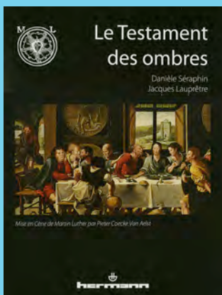
LE TESTAMENT DES OMBRES Danièle Séraphin, Jacques Lauprêtre Hermann – 45 €

Cette imposante revue d'environ 124 pages invite une vingtaine d'artistes/designers/dessinateurs à chaque numéro. Après une présentation (souvent en anglais) des créateurs, les pages sont entièrement dévolues à l'image. Il s'agit finalement d'une vaste revue des tendances de l'art international (occidental) qui montre à la fois les nouvelles esthétiques mais aussi les préoccupations et les fantasmes des créateurs actuels. Hey se qualifie en sous-titre de revue pour « modern art et pop art culture ».