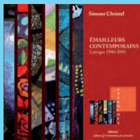
ÉMAILLIERS CONTEMPORAINS, Limoges 1940 – 2010 Simone Christel Éditions Culture & Patrimoine en Limousin – 24 €

La revue Art Press est née avant que ne soit créé le Centre Georges-Pompidou. Depuis 40 ans, la revue suit, accompagne, voire impulse la vie artistique qui se déroulait alors essentiellement dans la capitale. Le premier numéro (janvier 1973) contenait une interview de Marcel Duchamp par Catherine Millet, la fondatrice de la revue. Depuis, les rédacteurs sont devenus plus nombreux et les sujets se sont diversifiés vers d'autres formes de pensées créatrices (littérature, architecture, cinéma...). 40 ans plus tard, cette revue retrace son parcours avec les unes de tous ses numéros, les articles les plus marquants. Une rétrospective qui livre aussi une évolution du discours sur l'art.