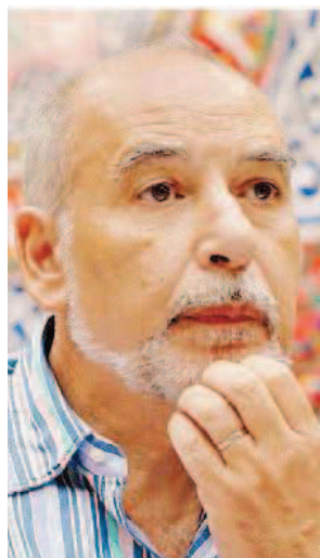
LO SCRITTORE Nella foto Tahar Ben Jelloun

È il momento di chiedere riforme nel mondo musulmano, scrive Ben Jelloun, come hanno fatto 67 intellettuali musulmani in un appello dell'11 gennaio: riforme che permettano l'esegesi dei testi e assicurino libertà di coscienza. Ma anche l'Occidente ha bisogno di cambiare. Abbiamo sostenuto dittature brutali, guardato senza batter ciglio come ai palestinesi di insediamento in insediamento siano stati portati via la terra e il futuro, portato violenza e caos in Iraq nel nome dei valori occidentali, siamo falliti miseramente in Siria dove abbiamo lasciato che i nostri alleati per perfidi calcoli politici finanziassero i jihadisti che oggi temiamo. Dall'11 settembre la risposta al terrore è sempre stata la guerra, la tortura, più odio e più violenza. Forse dovremmo aver imparato che la risposta dovrebbe essere diversa e che queste differenze, questi conflitti, queste contraddizioni non si possono più risolvere con la forza.