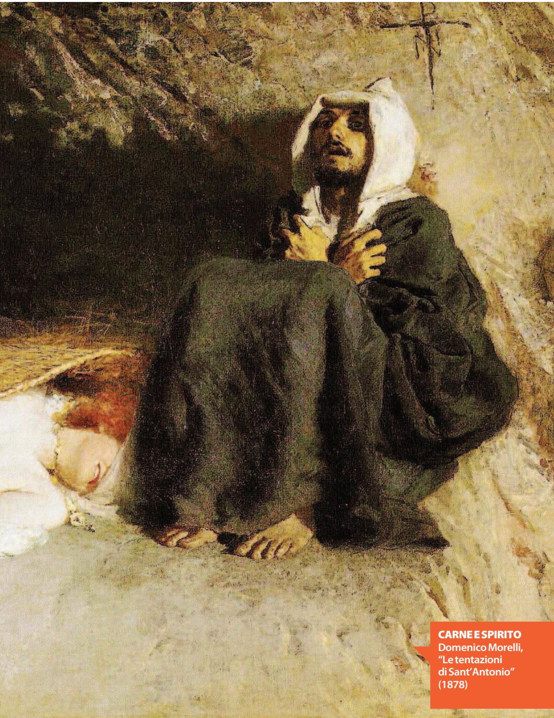
CARNE E SPIRITO Domenico Morelli, "Le tentazioni di Sant'Antonio" (1878)